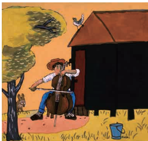
茂田井武 絵本『セロひきのゴーシュ』（福音館書店） 表紙原画 1956年 ちひろ美術館蔵

1956年、亡くなる半年前に「こどものとも」の2号として出版された『セロひきのゴーシュ』は、今も版を重ねている *3 。当時茂田井は病床にあって筆を取るのもままならない状態だったというが、宮沢賢治の童話と響き合う、ユーモアと素朴な詩情に満ちた絵を描き上げた。日本の絵本の文化がまさにこれから花開こうとする時期、この絵本が後に続く画家たちに与えた影響は大きい。