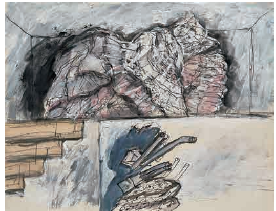
野見山暁治《室》1975年 野見山暁治財団寄贈