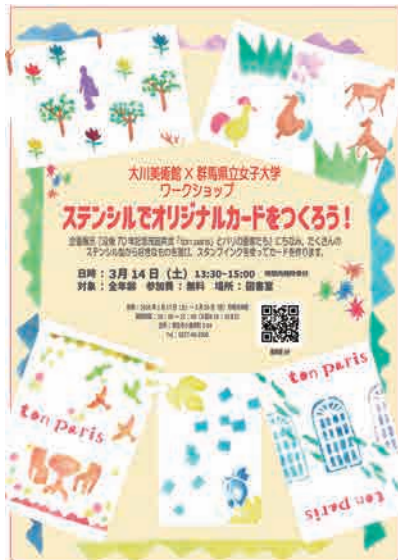
ワークショップチラシ