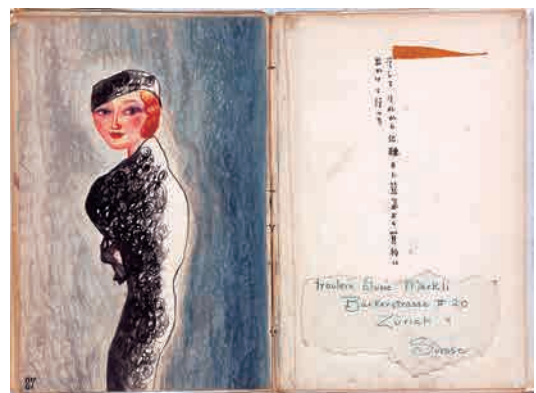
茂田井武 画帳《Parisの破片》より 1930年頃～35年頃 ちひろ美術館蔵

1932年1月から8月頃まで、茂田井はジュネーブに長期出張し、その後も翌年春までパリと行き来していた。《続・白い十字架》はスイスに滞在した日々の情景を描いた画帳だ。レマン湖畔の陽光あふれる風景や、子どもたちの姿などが描かれている。茂田井がジュネーブにいた時期は、国際連盟の本部があったこの街で、軍縮会議が行われた時期に重なる。第一次世界大戦の反省から設立した国際連盟だったが、1933年には日本とドイツが脱退し、再び世界が戦争へ向かうのを止めることができなかった。この画帳の最後には、戦争で傷ついた兵士の姿が描かれている。