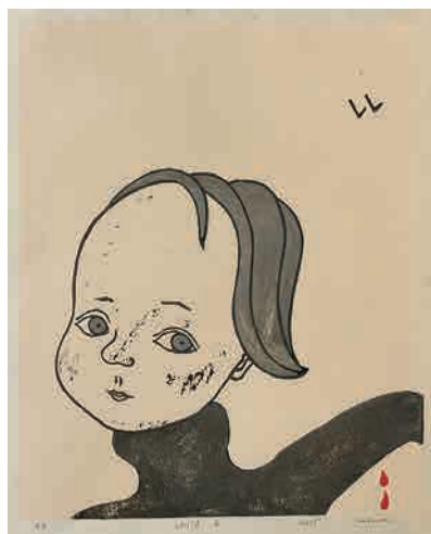
丸尾康弘《Child 4》2003年 作者寄贈