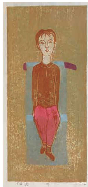
丸尾康弘《待》1996年 作者寄贈