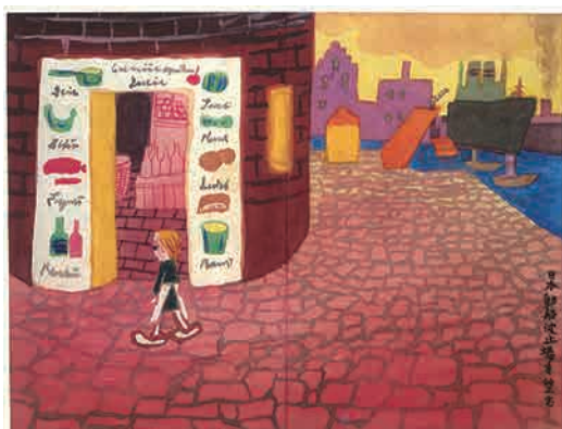
茂田井武 画帳《古い旅の絵本》より 1943～44年 ちひろ美術館蔵

茂田井は「印象のレンズ 私の描きたい絵」 *2 というエッセイのなかで、描きたい絵について「記憶にひっかかってぬけないもの、過去の印象の鮮明なもの」と語っている。脳中の印象を紙に焼き付けるように一枚一枚と描き続けていくうちに、想い出の映像は濃度を増して、「その時そのままの不死の姿」に近いものになっていくという。旅先で描いた画帳の多くは戦災で消失したが、記憶の中の光景は濃縮されてこの画帳に描き出されている。